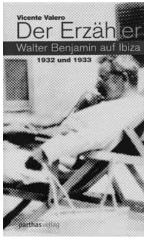
s. Seite 13